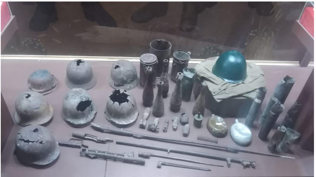
Это трофеи - результат раскопок на Кубани в местах воинских сражений.