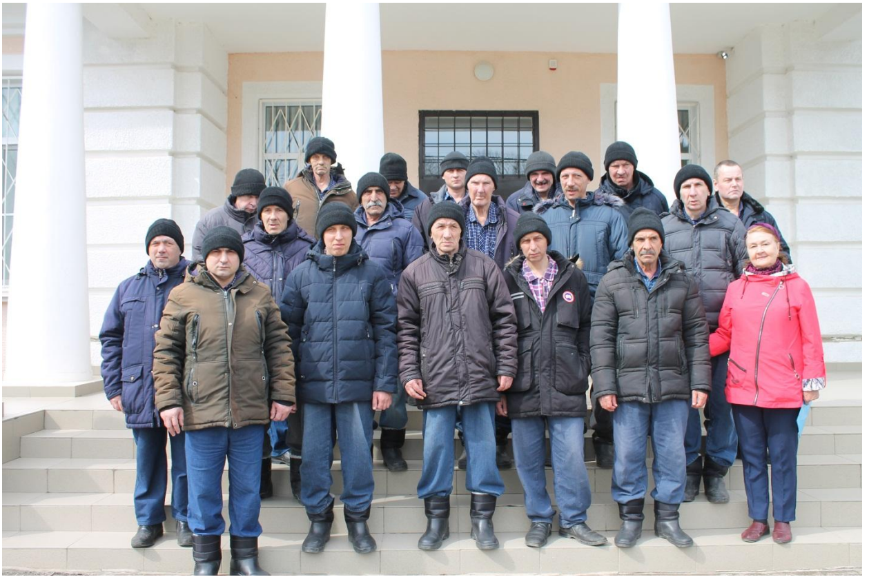
Группа проживающих третьего корпуса на экскурсии в картинную галерею