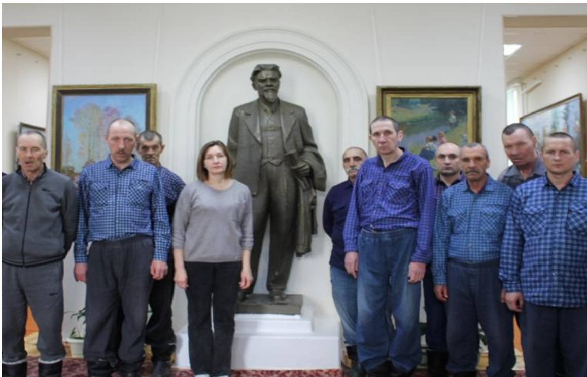
Памятник Калинину Михаилу Ивановичу