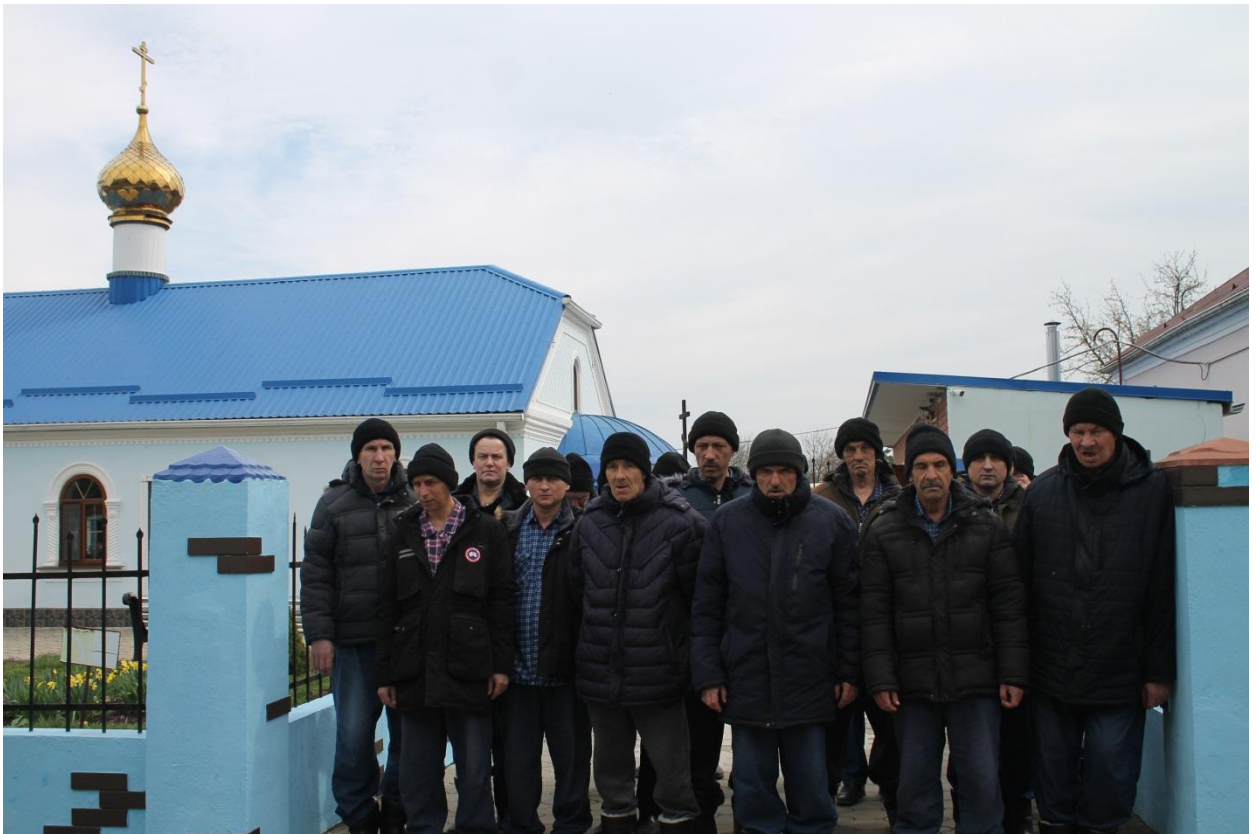
Групповая фотография проживающих у храма иконы Божьей Матери «Скоропослушницы»